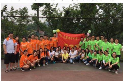
研究生素质拓展活动