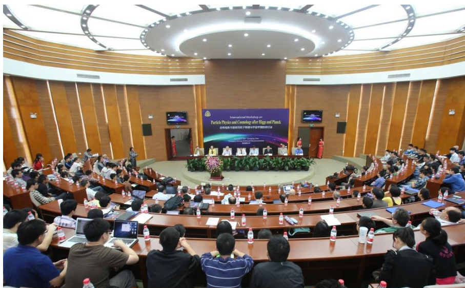
学院举办后希格斯与普朗克国际研讨会