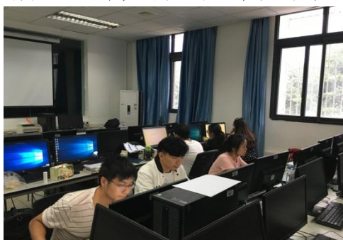
全国研究生数学建模竞赛现场

学院注重研究生培养质量，近年来毕业研究生就业率 100%，其中 30%的毕业生继续攻读博士学位，升学学校包括中国工程物理研究院、复旦大学、中国科学技术大学、中国人民大学、南方科技大学、中山大学、同济大学、大连理工大学、华东师范大学、西安电子科技大学、重庆大学、南京航空航天大学等国内双一流高校和科研院所，60%的毕业生到高校、科研院所等国有企业、事业单位工作，就业单位包括华为、中电科技集团、京东方显示技术有限公司、长安汽车股份有限公司等，深受用人单位的好评。