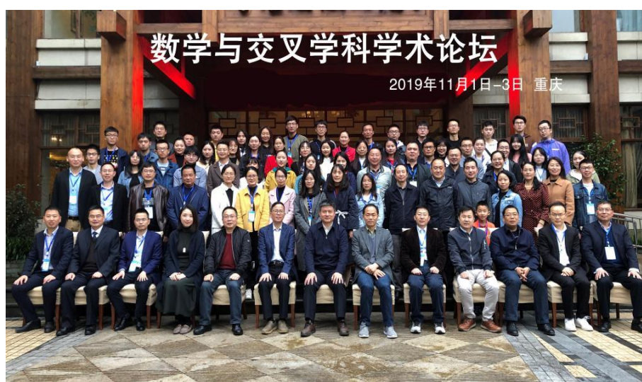
学院举办数学与交叉学科学术论坛