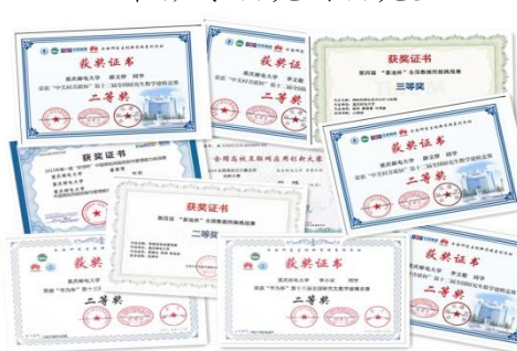
研究生参与学科竞赛获奖证书